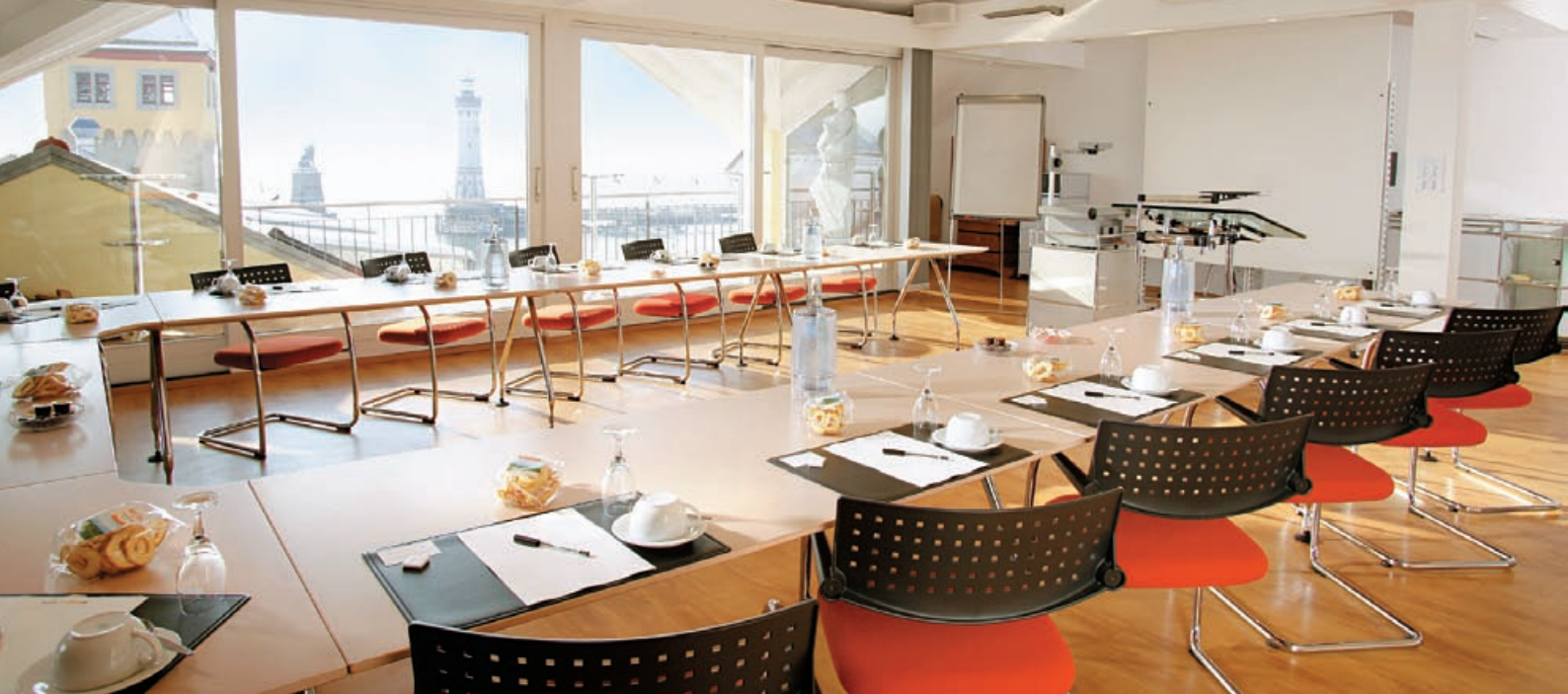
Lake-Lounge 120 m 2 mit offenem Kamin für bis zu 30 Personen / grandioser Blick auf den Bodensee und den Lindauer Hafen

Die Tagungslounge, die sich im ca. 400 m 2 großen „Business-Floor“ befindet, präsentiert sich mit einer außergewöhnlichen und funktionalen Ausstattung, nach ergonomischen Grundsätzen geplant.