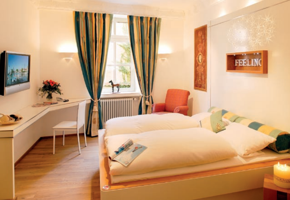
Wellroom mit wunderbarem Relaxparkett und Inner-Balance-Konzeption