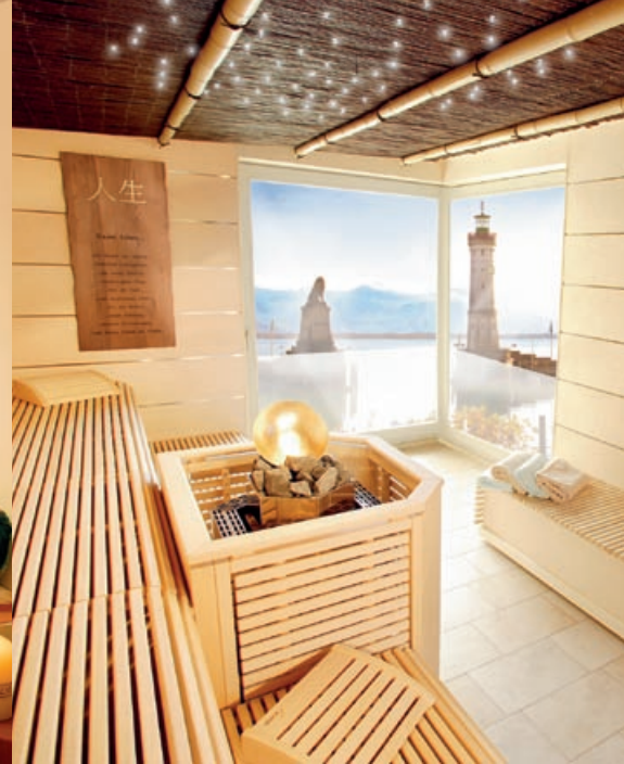
ZEN-Sauna mit direktem Seeblick

Im neu eingerichteten Spa-Bereich über zwei Etagen wird eine Fülle von Angeboten offeriert.